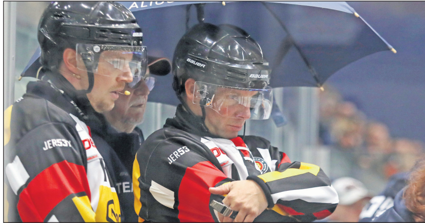
Die Hauptschiedsrichter schauen sich eine Szene im Videobeweis an

Der berühmt-berüchtigte „Kölner Keller“ rückte vergangenes Wochenende in der Fußball-Bundesliga besonders in den Fokus. Nach einem vermeintlich erzielten Tor von Union Berlin im Spiel gegen den FC Bayern München griff der Videoschiedsrichter ein. Nach der Überprüfung mit dem virtuellen Abseitsstool wurde das Tor aberkannt. Der Union-Spieler hatte die Fußspitze circa fünf Millimeter näher zum Tor – Abseits! Der Aufschrei war fortan groß und der Ruf nach der Abschaffung des ganzen Systems wurde laut. Sicherlich gibt es seit der Einführung des Videobeweises zur Saison 2016/2017 auch in der DEL2 die eine oder andere strittige Szene. Allerdings sind diese in Relation zur Anzahl der Spiele sowie der Einsatzsituationen höchst selten. Man kann also sagen: Sowohl die Schiedsrichter als auch Teams und nicht zuletzt die Fans vertrauen auf das System. Dieses haben sich die Clubs in der Liga-Gesellschaft auch einiges kosten