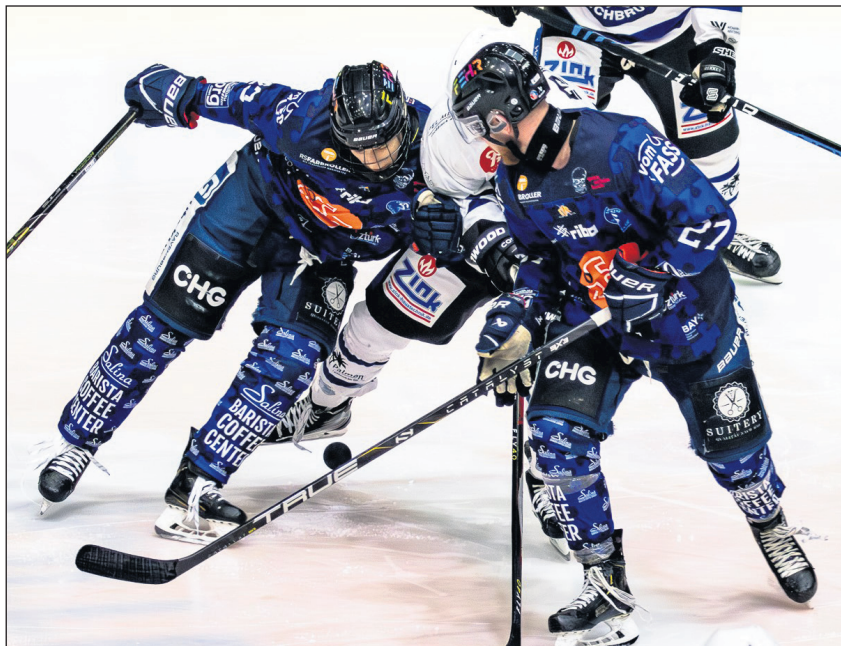
Neben dem Einsatz sollen bei der 1b am Wochenende auch die Ergebnisse wieder stimmen

Die braucht dringend auch die U20. Mit dem 6:4-Coup beim Tabellenführer München hat das Team bewiesen, dass es in der DNL III konkurrenzfähig ist. Nur die „rote Laterne“ sollte man